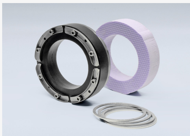
Tesniaca sada WRD