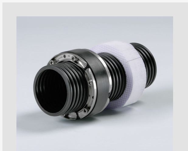
Inštalácia korugovaného potrubia