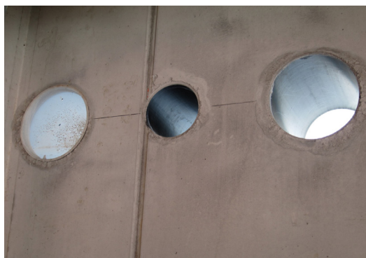
Pažnica HRD FU po betonáži