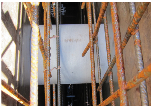
Pažnica HRD FU upevnená v debnení