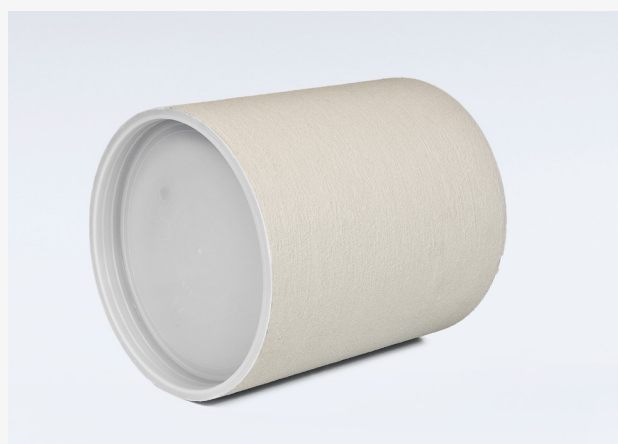
HRD 200 FU/300

Pažnica HRD FU je vyrobená z veľmi pevného nemäkčeného plastu a má špeciálny cementový povrch. Tieto materiály zaisťujú vysokú odolnosť voči deformácii a zároveň spoľahlivé spojenie s okolitým betónom. Je možné ju osadiť do debnenia alebo dobetónovať do otvoru v stene. Vyrába sa s vnútornými priermi 80, 100, 125, 150, 200, 250 a 300 mm. Po betonáži dosahuje tesnosť do 5 barov. V spojení s našimi tesneniami vytvára úplne plynotesný a vodotesný prestup všetkých typov inžinierskych sietí. V prípade použitia v podlahe odporúčame pažnicu inštalovať spolu s tesnením HRD alebo HSD.