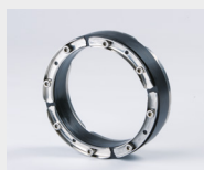
napr. HSD 200/159