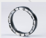
napr. HSN 200/159

Pre tesnenie > Ø 250 mm dodávame delený variant