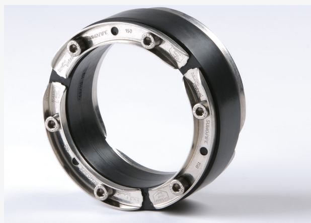
P-PIPE Basic 1