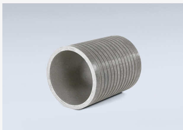
Pažnica HRD-FU2 (FZR) Príklad: HRD 200-FU2/300

Bez-azbestové pažnice vyrobené z vláko-cementu umožňujú spoľahlivé priestupy pre všetky druhy potrubia a káblov cez steny, stropy a podlahy. Pažnice je možné jednoducho osadiť do betónu, obmurovať alebo vsadiť do otvoru v stene a zaliť maltou. Drážky na vonkajšom povrchu vytvárajú tesné spojenie s okolitou skladbou. Pažnice sú korózii odolné, plynovo-vodotesné proti tlakovej vode a úplne nevodivé. V spojení s našimi tlakovými tesneniami HRD a SUMO, vytvára úplne plynovo-vodotesný priestup všetkých typov inžinierskych sietí.